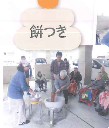
「よいしょー」寒さなんかには負けへんで!