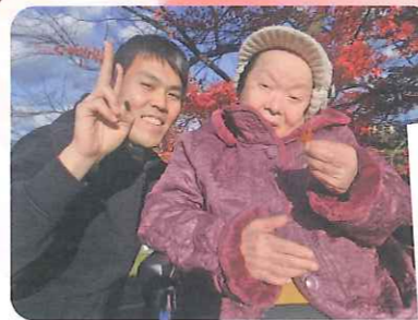
ねえ、キレイでしょ?