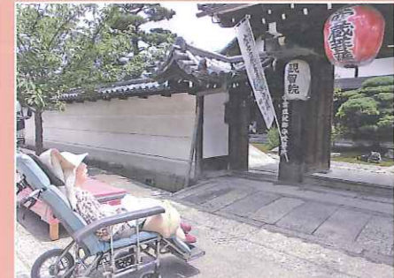
東寺に行ってきました