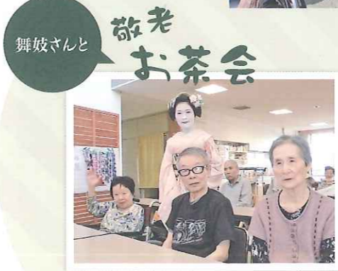
舞妓さんと敬老お茶会