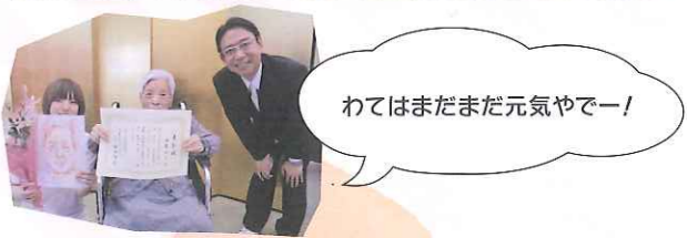
わてはまだまだ元気やでー!