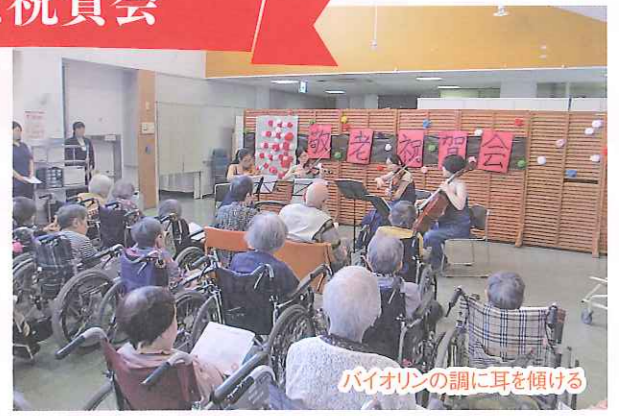
バイオリンの調に耳を傾ける