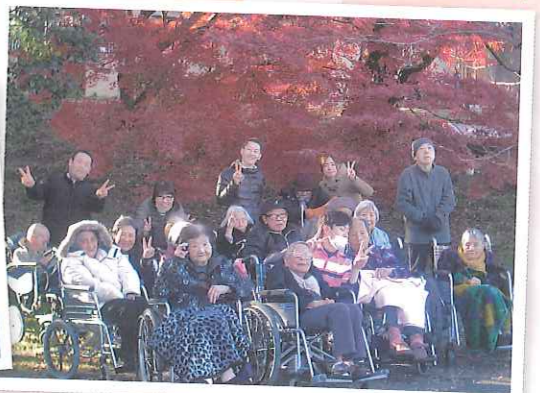
みんな揃って、はいチーズ!