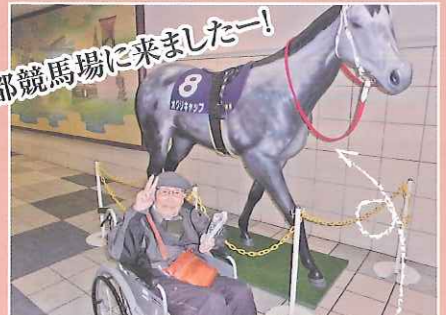
京都競馬場に来ましたー!