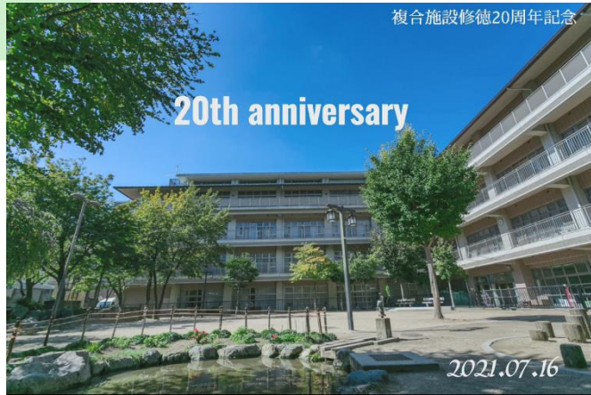
複合施設修徳20周年記念