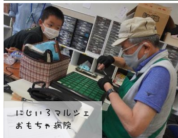
にじいろマルシェ おもちゃ病院