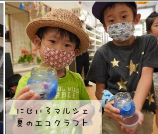
にじいろマルシェ 夏のエコクラフト