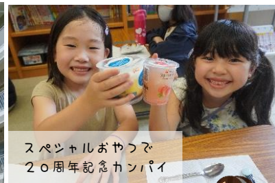
スペシャルおやつで20周年記念カンパ