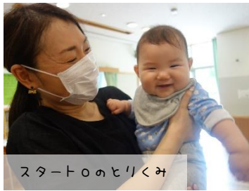
スタートのヒリくみ