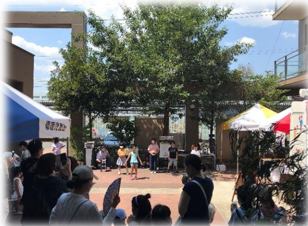
OPは小学生のダンス「カラフルメンバー」

7/2 (土) 七夕まつり 本当に暑い一日でした。給水所も設置して暑さをしのぎながら楽しみました。 あそびに来てくれた方、スタッフのみなさん、ありがとうございました！