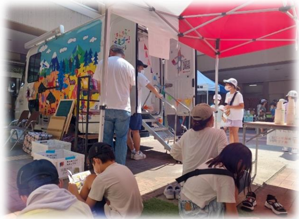
はしる図書館 日本新薬きらきら未来ゴー！