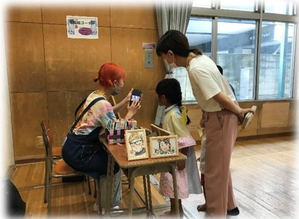
イラストレーターasami_paintさんの似顔絵