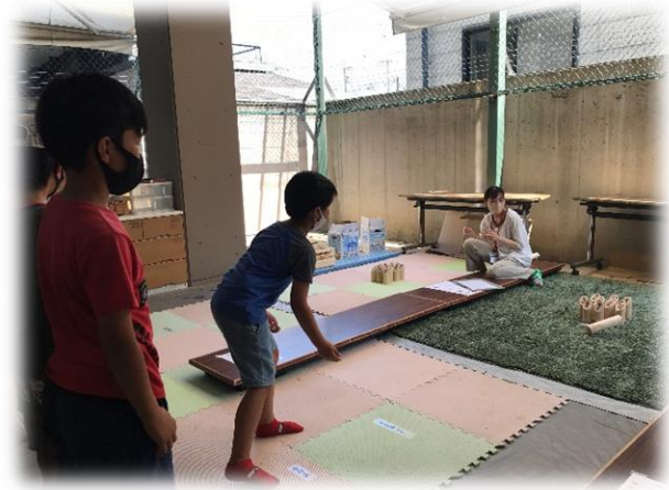
初体験のモルック。日本代表になれるかも？！