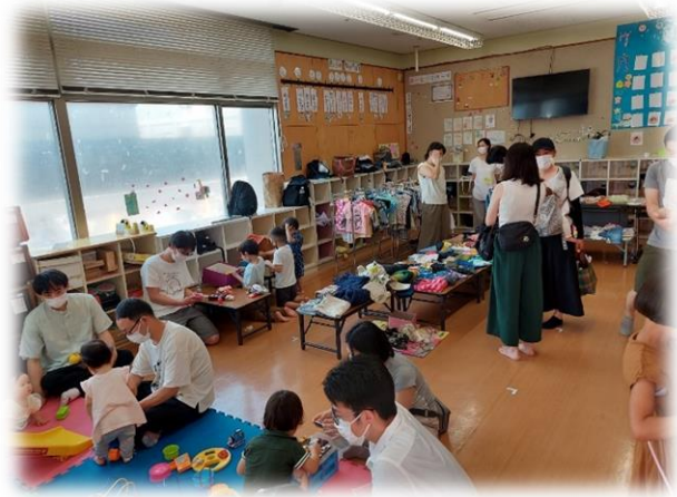
くるくる&とーにゃん広場 パパもたくさん*